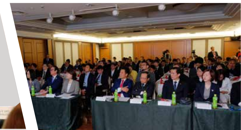
Các khách mời chăm chú theo dõi thông tin cơ hội hợp tác từ Tập đoàn TMS