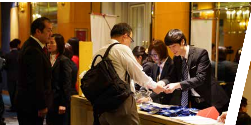
Các hướng dẫn viên tiếp đón khách mời đến dự sự kiện