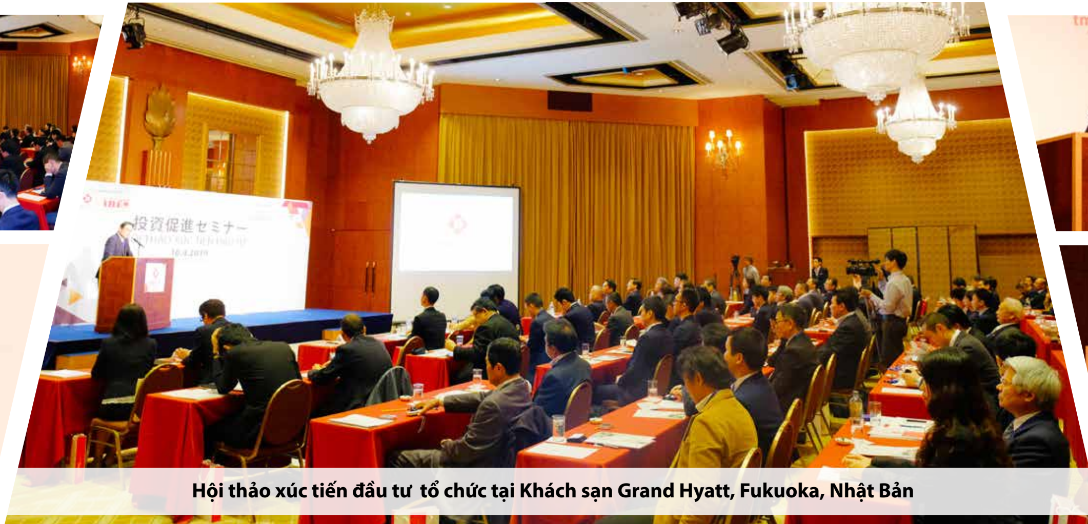
Hội thảo xúc tiến đầu tư tổ chức tại Khách sạn Grand Hyatt, Fukuoka, Nhật Bản