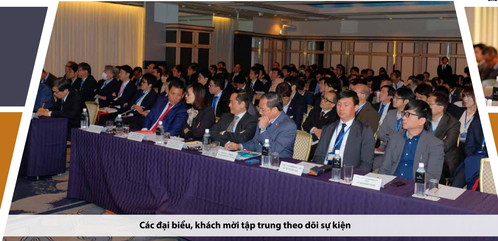
Các đại biểu, khách mời tập trung theo dõi sự kiện