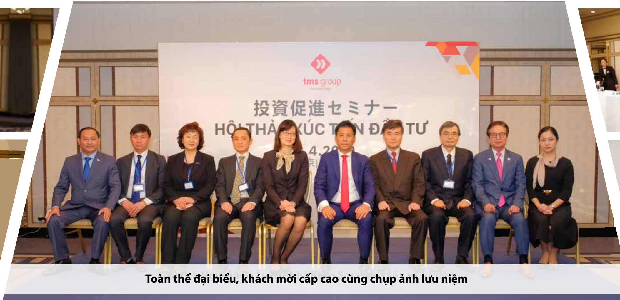
Toàn thể đại biểu, khách mời cấp cao cùng chụp ảnh lưu niệm