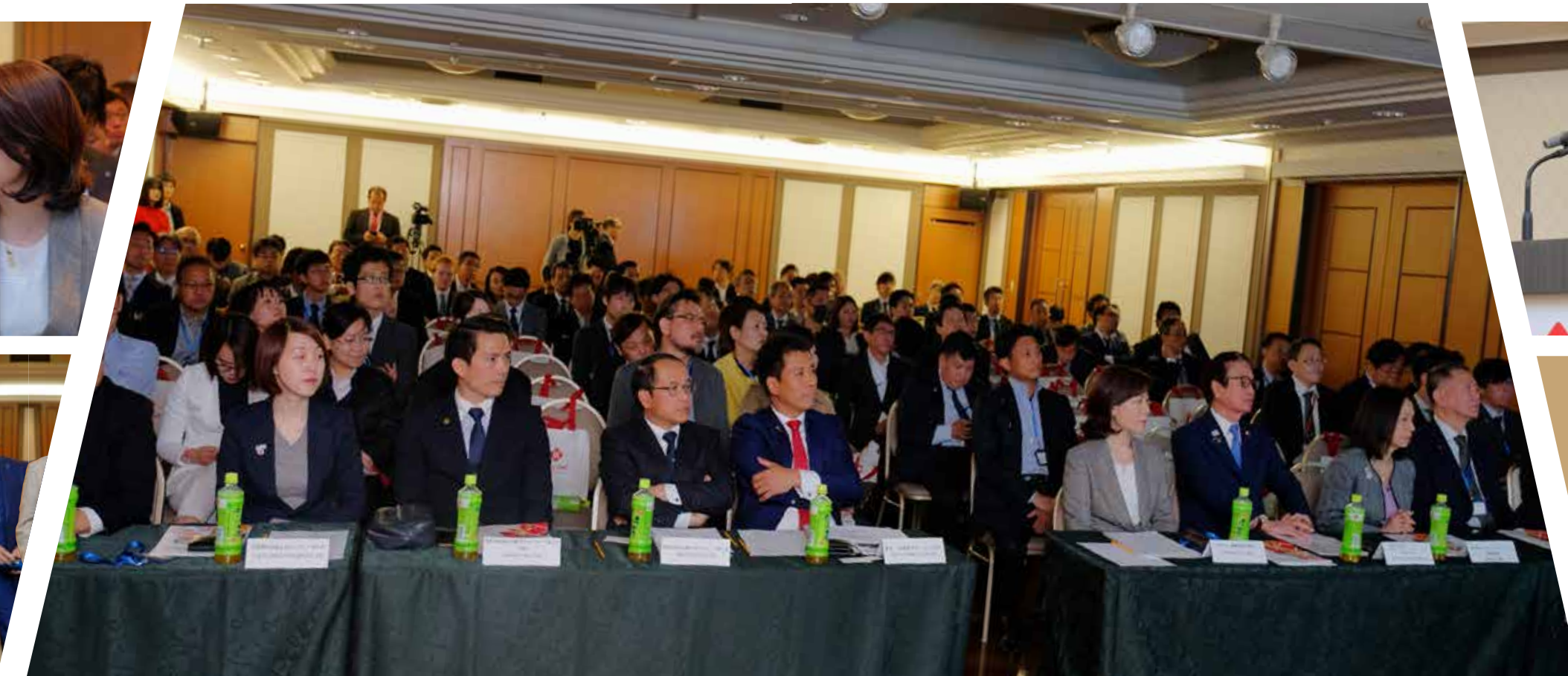
Toàn cảnh khách mời tham dự hội thảo tại Osaka