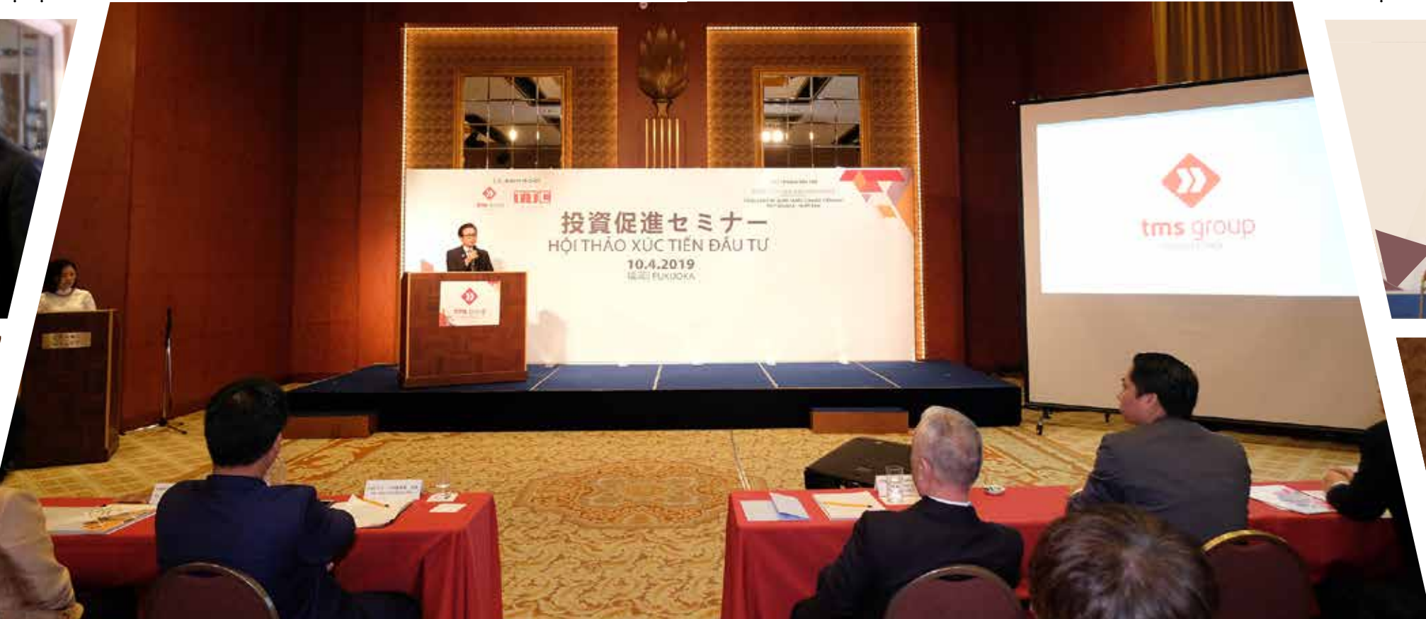
Hội thảo là cầu nối cho các khách mời Nhật Bản - Việt Nam gặp gỡ, trao đổi thông tin về môi trường và lĩnh vực đầu tư của hai bên