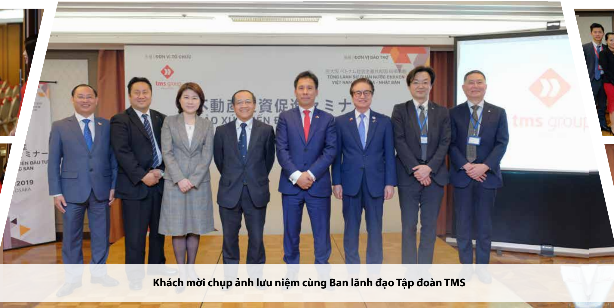
Khách mời chụp ảnh lưu niệm cùng Ban lãnh đạo Tập đoàn TMS